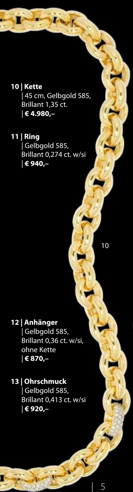
10 | Kette | 45 cm, Gelbgold 585, Brillant 1,35 ct. | € 4.980,-