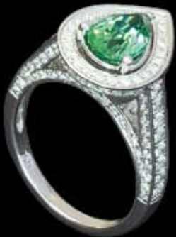
Ring | Weißgold 750, Brillant 1,04 ct. tw/vs2, Turmalin grün 1,42 ct. | € 2.268,-