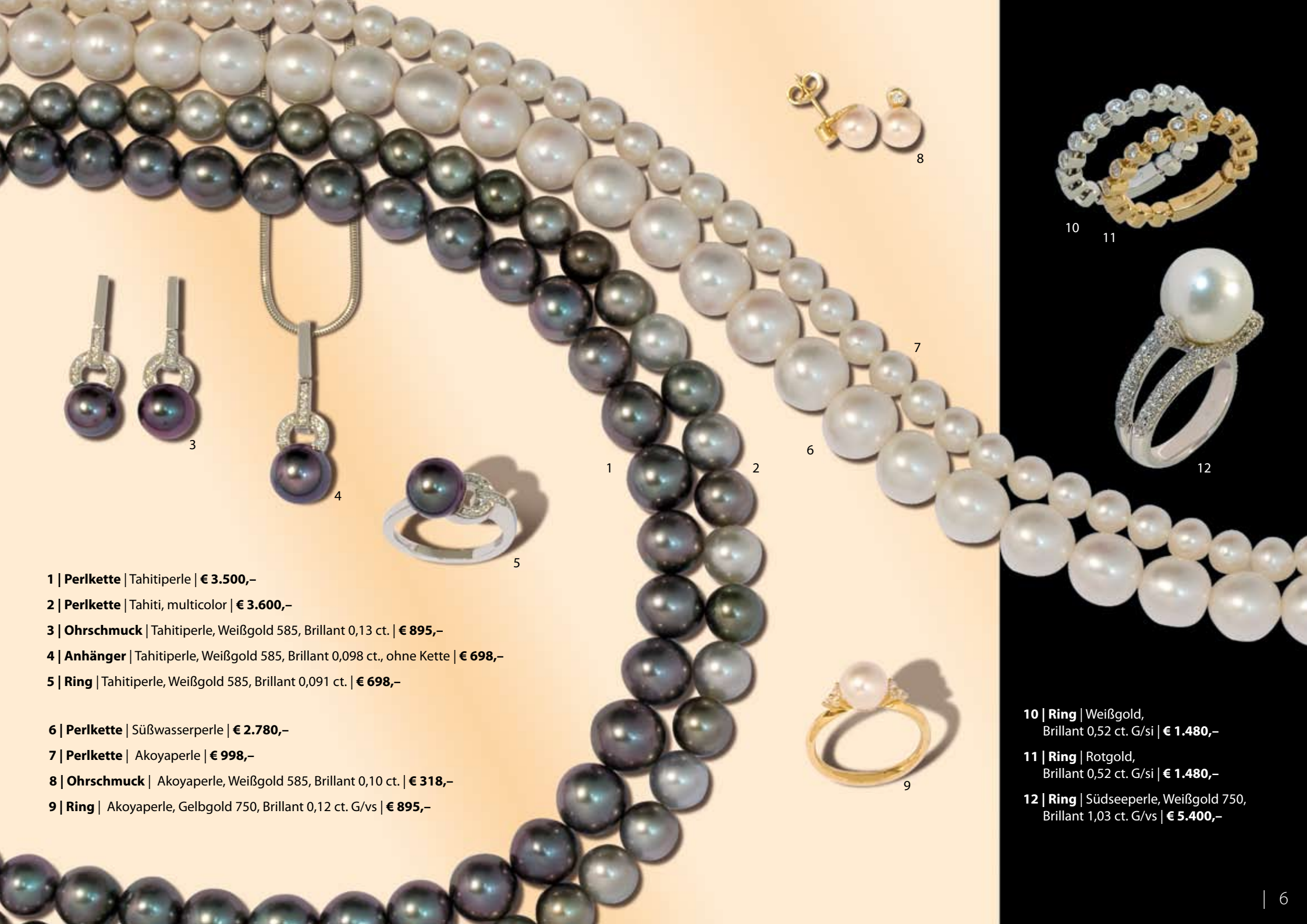
1 | Perlkette | Tahitiperle | € 3.500,-