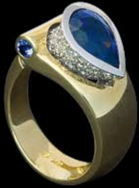
Ring | Gelbgold 750, Brillant 0,96 ct. tw/si, Tansanit 2,70 ct. | € 6.284,-