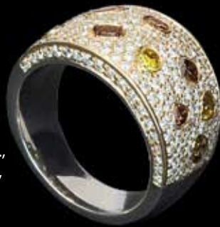
Ring | Weißgold/Rotgold 750, 9-farbige Brillanten 1,19 ct., 222 Brillanten 1,75 ct. G/vs, | € 11.800,-