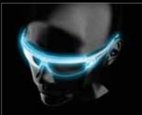
Wrap around Vision