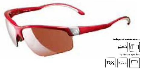
retego graphics series a376