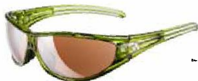
evil eye L/S a266/267

10 Jahre evil eye. Die evil eye ist ein Klassiker bei Profis und ambitionierten Athleten im Bike Bereich. Bei Olympischen Spielen, Weltmeisterschaften und MTB Freeride Events stand die evil eye immer ganz oben auf dem Podest. Auch bei zahlreichen Bike Movies wie Kraked , The Collective , Seasons , Roam ,... wurde sie ins Rampenlicht gerückt. Ihr Erfolgsrezept: erstklassige Technologie gepaart mit zeitlosem, progressivem Design.