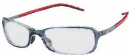
fullrim SPX™ a886/8 base

Design und Technologie - vom Sport inspiriert. Mit der ambition Kollektion geht adidas eyewear bei den optischen Brillen ganz neue und außergewöhnliche Wege. Innovative Materialien und modernste Technologien aus dem Sportbereich, wie der Hybrid Memory Hinge™, garantieren höchsten Tragekomfort und perfekten Sitz.