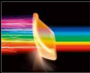
Light Stabilizing Technology (LST)™